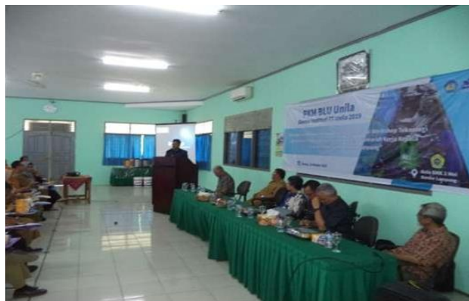
Gambar 1. Pemateri menyampaikan materi

Metode pengabdian ini dilaksanakan dengan pendekatan yang terstruktur dan aplikatif. Pendekatan yang digunakan terdiri dari tiga tahapan utama, yaitu ceramah, demonstrasi langsung ( workshop ), dan evaluasi hasil kegiatan. Proses kegiatan pengabdian kepada masyarakat ditunjukkan oleh Gambar 1.