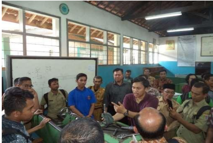
Gambar 2. Demonstrasi di Workshop

Pada Gambar 2 sesi demonstrasi dilengkapi dengan diskusi interaktif. Diskusi interaktif memberikan kesempatan kepada peserta untuk mengajukan pertanyaan dan berbagi pengalaman terkait topik yang telah disampaikan. Selain itu, evaluasi dilakukan melalui pre-test dan post-test untuk mengukur sejauh mana pemahaman peserta terhadap materi yang telah diajarkan. Hasil dari evaluasi ini digunakan untuk menilai tingkat keberhasilan kegiatan dan memberi masukan untuk kegiatan pengabdian selanjutnya. Sebagai tindak lanjut, penandatanganan Nota Kesepahaman (MoU) antara Fakultas Teknik Unila dan beberapa SMK di Bandar Lampung dilakukan. Tujuan dari penandatanganan Nota Kesepahaman untuk memperkuat kerja sama dalam pengembangan kurikulum dan peningkatan kualitas Pendidikan. Peningkatan kualitas Pendidikan berfokus dalam penerapan teknologi material maju. Dengan pendekatan ini, diharapkan Kepala Sekolah dan guru-guru SMK dapat memperoleh pemahaman mendalam yang dapat diimplementasikan dalam proses pengajaran dan pengembangan kurikulum di sekolah masing-masing.